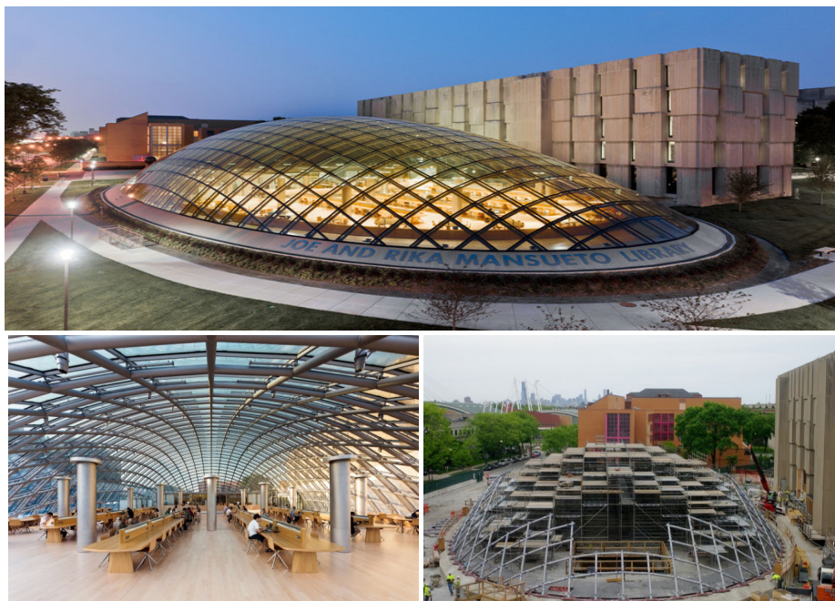
Слике 5,6. Библиотека Joe and Rika Mansueto, Чикаго, САД

свих библиотека – недостатак простора за складиштење може бити инспирација за креирање нових необичних просторних решења. По пројекту архитекте Хелмута Цана (Helmut Jahn) створен је нови тип библиотеке из потребе за проширењем простора постојеће универзитетске библиотеке. Климатизовани масивни складиштени систем смештен је у подземном простору, а испод елиптичне куполе од транспарентних стаклених панела налазе се читаоница и одељење за конзервацију, рестаурацију и дигитализацију. Максимална искоришћеност простора читаонице постигнута је кружним распоредом и величином столова чије се димензије смањују ка централном делу, до испод највишег дела куполе (11 метара). Стакленом куполом са специјалном заштитом и осветљењем из металних стубова у којима су и машински системи, омогућена је адекватна осветљеност простора и током дана и током вечери. Из спољашње перспективе видљива је само купола у сачуваним зеленим површинама кампуса.