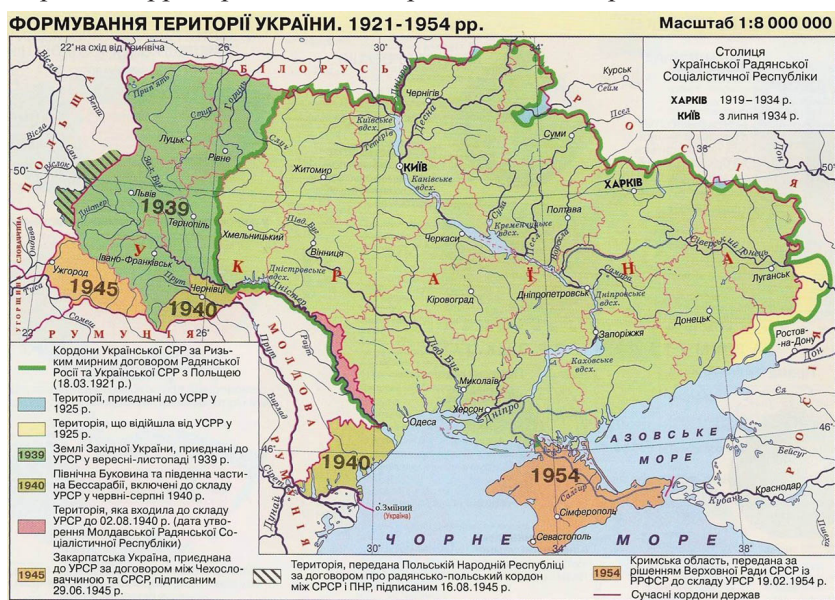
Карта 6. Территориальные подарки Сталина Украине.

О возврате демократичной Украиной «незаконно отторгнутых» польских земель речи не идет.