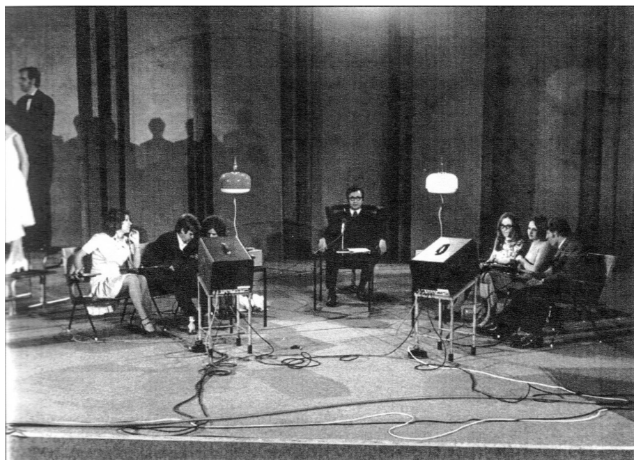
Slika 3. Ekipe MO Aleksinca u finalu Kviza MOS-a 1972. godine. Izvor: Tomislav Bratić, Letopis muzičkog života u Aleksincu , 327.

Niša, đaci Muzičke i Tekstilne škole, obišli su 1967. godine kulturne i istorijske spomenike glavnog grada Bugarske, a potom prisustvovali izvođenju Verdijeve opere Trubadur u Sofijskoj operi. 109