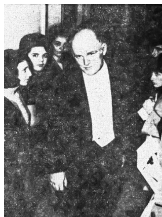
Slika 5. Svjatoslav Rihter s članovima MO Niša.

Mapa zemalja iz kojih su, zahvaljujući međunarodnoj saradnji MOJ-a sa srodnim inostranim organizacijama, omogućena gostovanja umetnika i ansambala obuhvata područja Zapadne i Istočne Evrope, Amerike i Kanade. 129 Najveći broj njih posetio je Aleksinac i Niš, dok su, prema dostupnim izvorima, koncerti Duvačkog kvinteta iz Belgije, inače održani u Pirotu i Dimitrovgradu 1973, kao i koncert umetnika iz Poljske „Nove boje i zvuci”, koji je održan u Pirotu 1976. godine, bili jedini nastupi stranih izvođača u ovim gradovima. 130 Jedan od najznačajnijih koncertnih događaja u Nišu u drugoj polovini 20. veka – resital Svjatoslava Rihtera (Рихтер) u novembru 1967. godine – nije održan u organizaciji MO, ali su njeni članovi uspostavili kontakt s čuvenim pijanistom. Rihter je postao počasni član MO Niša, od koje je na poklon dobio komplet gramofonskih ploča s delima Stevana Mokranjca. 131