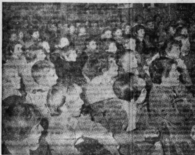
Najmlađi, možda na prvom koncertu

Tako će dječak iz Svetozareva, koji je danas doputovao na »Soročinski sajam», poželje-