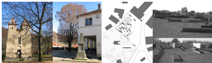
Прилој 2. Село Доња Каменица код Књажевца

месне канцеларије, неколико занимљивих стамбених објеката и споменика ратницима 1912–1918, садржи и цркву посвећену Пресветој Богородици из прве четвртине XIV века, која је необичне архитектуре и која је заштићена као грађитељска баштина од изузетног значаја – споменик културе. Пример се овде наводи као изузетно амбијентално вредан простор, који би у даљем уређењу уз ревитализацију, пренамену и активирање профаних садржаја, као и конзерваторске радове на цркви, могао да доживи значајне промене. Идеја да се простор дефинише као динамична сцена, са својим фронталним експонираним делом, као контраст статичности и вечности цркве, чиме се ствара услов за стециште културе у миљеу мале средине, што представља креативну провокацију. Додатно би се истакле појединачне вредности сачуваних грађевина, а у туристичком смислу формирао би се реперни брендирани амбијент у коме би боравак и посета постали ствар престижа и стандарда попут многих сличних места културе. 22