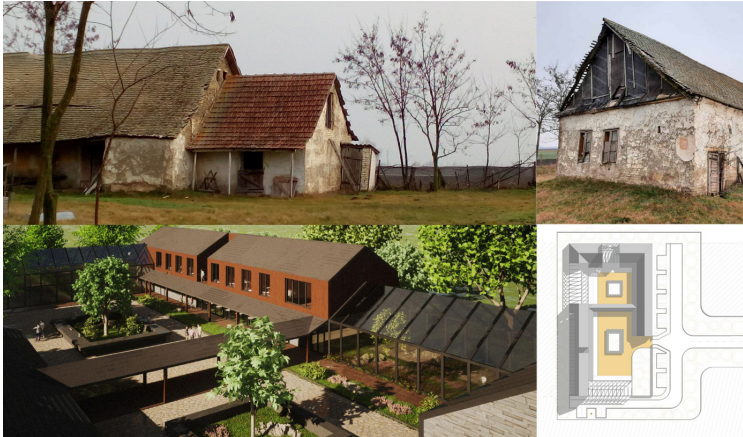
Прилој 5. Салаш (Војводина, Панонска низија)

Салаше су самостална сеоска домаћинства (Прилог 5) са стамбеном и економском функцијом, карактеристична за Панонску низију, лоцирана у непосредној близини пољопривредног земљишта. На њима су чланови, или читаве породице, живеle током године у жеку радова у пољу, а некада и стално. Задатак намењен студентима био је ревитализација и програмско осавремењавање (реконструкција, пренамена, адаптација, доградња, надградња, ремоделација...) постојеће групације – физичке структуре старог салаша у оквиру приградске територије насеља Александрово код Суботице на северу Бачке (Србија). Ови облици специјалног живота и рада ван насебина били су организовани за породичне