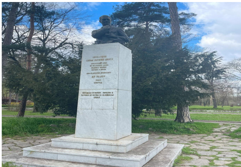
Слика 3: Споменик др Арчибалду Рајсу у Топчидерском парку у Београду