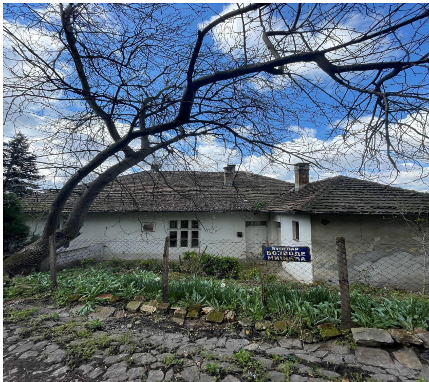
Слика 1: Кућа др Арчибалда Рајса у Београду