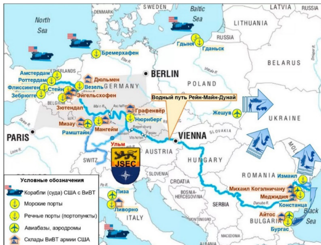
Пловни пут Рајна-Мајна-Дунав РУМУНСКИ ТРАГ

Пловидба од Ротердама до Сулине траје 10,5 дана за самоходне бродове и 13,5 дана за потискивани конвој.