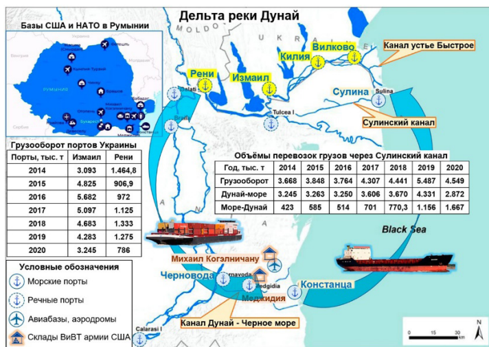
Инфраструктура у делти Дунава

На територији уз делту Дунава, поред дванаест морских и речних лука (Румунија – 8, Украјина – 4), налази се и ваздушна база „Михаил Когелничану” и два објекта за складиштење залиха америчке војске: један у истоименом насељу где је и ваздушна база, други у речној луци у насељу Међидија на каналу Дунав – Црно море, што је врло погодно логистичко чвориште за транспорт војног терета, поготово када се узме у обзир да растојање између њих не прелази 44 km, а повезани су не само железницом и путевима, већ и пловним путевима.