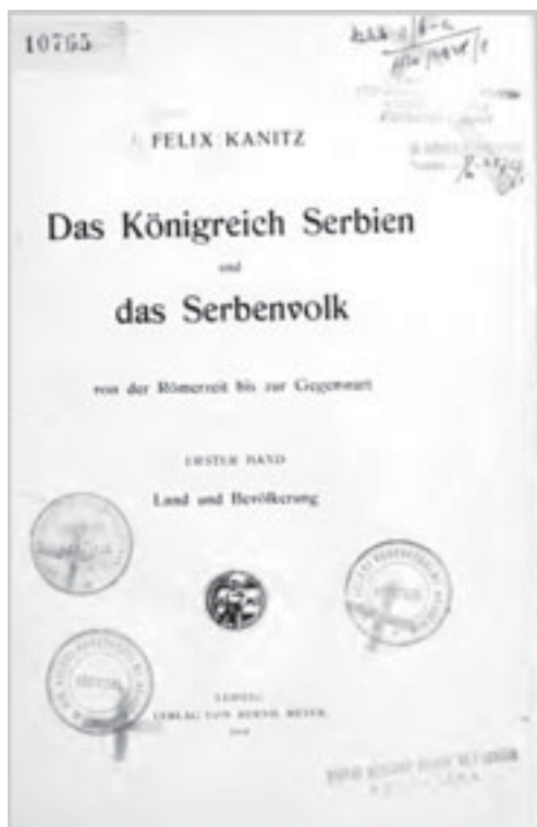
Први том дела Феликса Каница Краљевина Србија и српски народ, Лајпциг 1904.

Феликс Каниц тврдио, темељна промена наступиће тек доласком бечког ђака Александра Бугарског, који је пројектовао нову зграду двора . Тада се у потпуности одбацују оријентални утицаји у ентеријеру, а израду намештаја обавиле су стране компаније Портоа и Фикс из Беча. 15 Према тумачењу Спиридона Гопчевића у студији из 1888. године, Бугарски је имао намеру да нови двор буде урађен по узору на палату Луја XIV. 16 Једна од тачака где су се тенденције трансфера нарочито примећивале био је кнежев конак у Топчидеру. Описујући промене, Каниц је нагласио да је кнез Милош инсистирао на увозу сорти воћа из Штајерске и њиховом гајењу на владарском имању. Систем наводњавања на овом поседу урадили су бугарски мајстори, а Каниц је претпостављао и да је то била примена технологије из Француске и Шпаније. 17