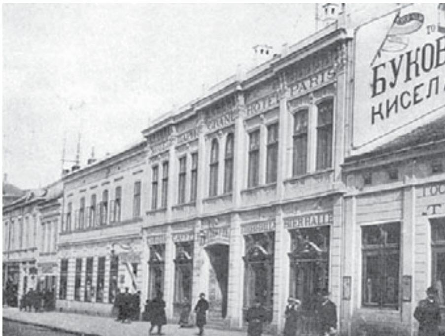
Хотел Париз у Београду.

Обреновићи су, посебно кнегиња Љубица, неретко одлазили у Земун где су васпитавали једну од Милошевих ћерки. Земун је, поред Беча и других хабзбуршких градова, апострофиран и као једна од важнијих тачака одакле је владарска породица набављала неопходне потрепштине које су недостајале у Србији. 21