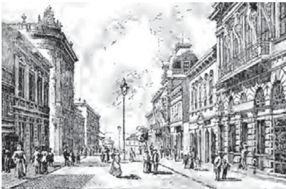
Народна банка у Дубровачкој улици (данас Краља Петра).