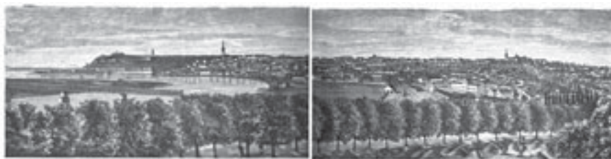
Панорама Београда са Топчидера објављена у књизи Спиридона Гопчевића.

Keywords: travelogues, Felix Kanitz, transfer, Occident, Orient