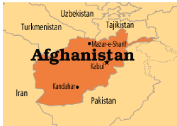
Мапа 1: Положај Авганистана и суседи (Collins 2011, 13)

Авганистан је јужноазијска држава на стратешком раскршћу између Централне Азије и Индијског потконтинента, са површином од 652.230 km 2 . У геополитичком смислу је хендикепирана држава јер нема излаз на море (Мапа 1), која се са запада граничи Ираном у дужини 921 km, Туркменистаном (744), Узбекистаном (137) и Таџикистаном (1.206), на североистоку са Кином (76) и Пакистаном (2.430 km) (Collins 2011, 5).