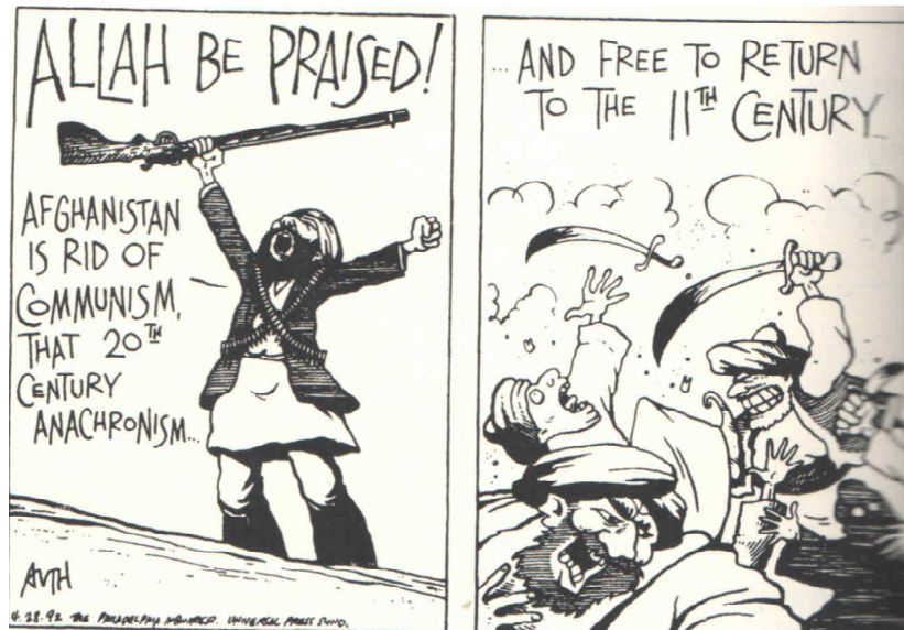
Карикатура о представи Авганистана на Западу (Rubin 2002: 2)

Најмногобројније племе у Авганистану, Паштуни, једноставно не прихвата никакав ауторитет, а интензиван осећај независности представља њихово непобедиво опредељење. Војну стратегију су увек прилагођавали освајачима. У периодима када нису ратовали против освајача, борили су се међусобно, испробавајући и увежбавајући нове тактичке замисли уз прилагођавање модернијем наоружању. Оваква паштунска војна оријентација изнедрила је изреку да је Паштун миран само када је рату, а слична теза може да се примени и на ратоборне талибане.