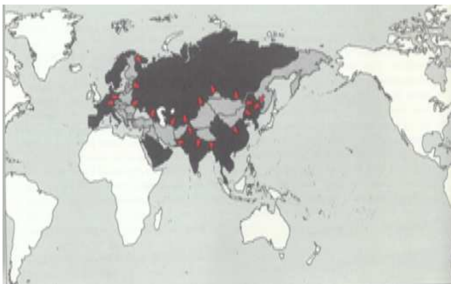
Мапа 2: Спајкменова мапа зоне конфликта између таласократских и телурократских сила у Евроазији (Хартланд против Римланда) из 1944. године (Spykman 1969: 52)

увео је иновацију у Мекиндеров диктуум и устврдио да „Ко влада Римлендом тај влада светом“. На Мапи 2 уочава се да је Авганистан означен као територија која припада зони сукоба између таласократских и телурократских сила, а Спајкмен констатује да је реч о територијама које оскудевају железничким и друмским комуникацијама, што им је умањивало стратегијски значај 40 .