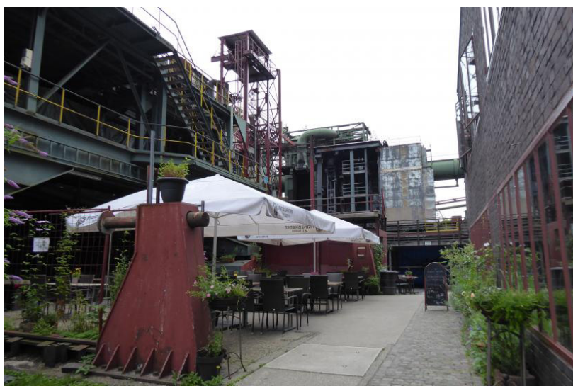
Slika 1. Objekat industrijskog nasleđa u Essen-u adaptiran za potrebe umetnika i razvoj kreativnih industrija

Kulturno nasleđe se smatra nezamenljivim resursom koji može da unapredi socijalni kapital, podstakne ekonomski rast i obezbedi održivost životne sredine. Kultura, uključujući kulturno nasleđe i kreativne industrije, ima važnu ulogu u postizanju inkluzivnog i održivog razvoja. To se odnosi na regeneraciju gradova i regiona u post-industrijskoj eri, kroz kulturno nasleđe, promovisanje adaptivne ponovne upotrebe objekata nasleđa 9 i izbalansiranim pristupom kulturnom nasleđu sa održivim kulturnim turizmom i prirodnim nasleđem.