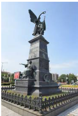
Slika 3. Spomenik kosovskim junacima