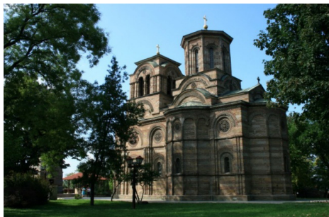
Slika 1. Crkva Lazarica