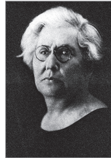
Прилог 4. Јелена Димитријевић, Жена и свет , 1928.

Јелена није престала да сања и машта ни у позним годинама. Била је активна на многим пољима, отвореног духа, радознала и космополита. Била је члан Енглеског клуба у Београду, где је често читала своје нове песме. Сарађивала је са групом филмских радника који су 1932. године снимали филм „На капији оријента“. 42 У пролеће 1940. у једном од последњих интервјуа рекла је: