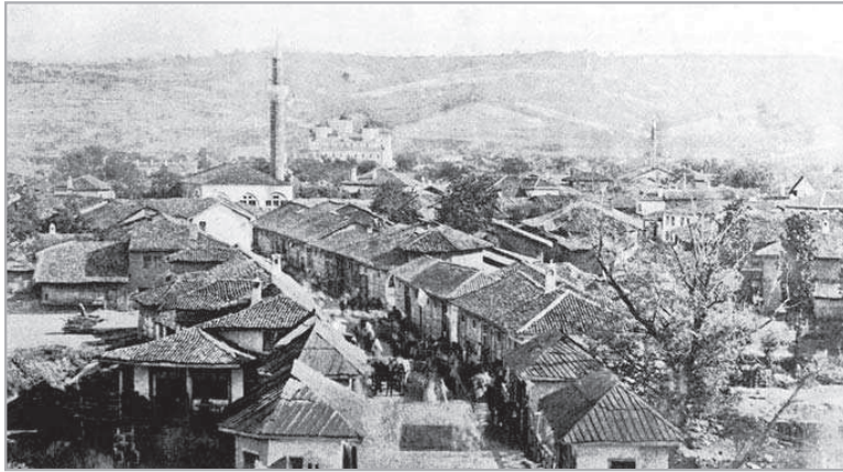
Прилог 1. Ниш после ослобођења 1878. године

Нишка подружина је временом почела да стиче леп углед. Од 1881. године чланице су основале фонд за подизање школе и цркве у Александрову на Мрамору, 4 а од 1883. до 1886. су издржавале једног питомца, сина свештеника који је погинуо у рату, кога су после гимназије послале у Београд, у Богословију. Прекретницу у раду подружине означило је оснивање занатске школе за девојчице. Школа је основана по угледу на Раденичку школу у Београду и у почетку су уписиване само сиромашне девојчице које су је похађале бесплатно. Уз то су им чланице друштва набављале одећу и обућу, а од треће године школовања ученице су добијале и део зараде која је остварена од продаје сашивеног рубља и хаљина. Успешан рад подружине и школе зауставио је Српско-бугарски рат 1885/86. године. Чланице су почеле да раде у болницама, а једну, са 35 кревета, саме су опремиле свим потребним стварима, постељином и санитарским материјалом. 5